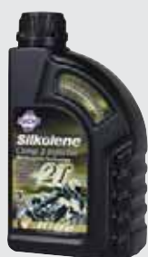
COMP 2 INJECTOR