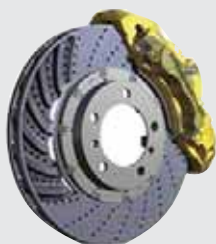
MAINTAIN DOT 4 | 5.1