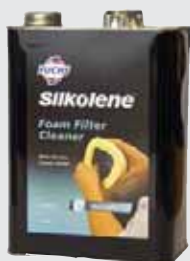
FOAM FILTER CLEANER