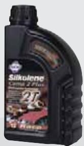
COMP 2 PLUS