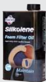
FOAM FILTER OIL