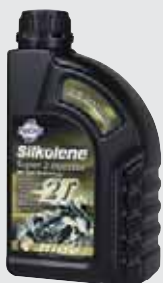
SUPER 2 INJECTOR