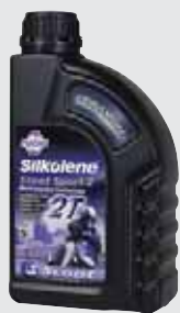
SCOOT SPORT 2