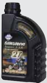
SUPER 2 SX