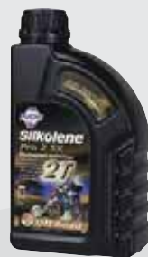
PRO 2 SX