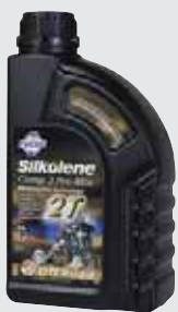
COMP 2 PREMIX