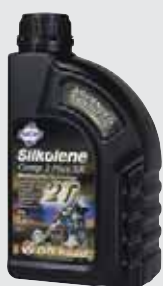
COMP 2 PLUS SX